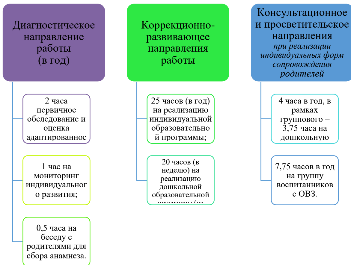
График организации образовательного процесса