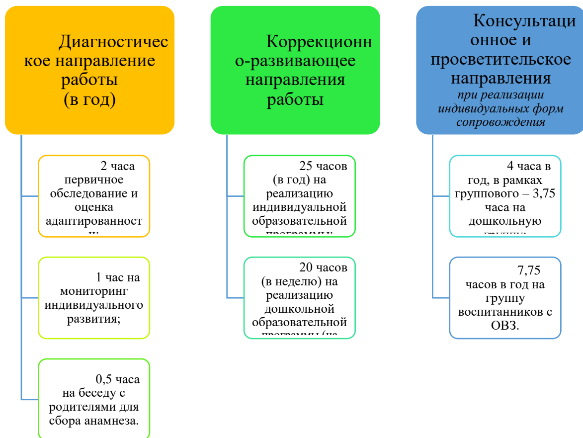
График организации образовательного процесса