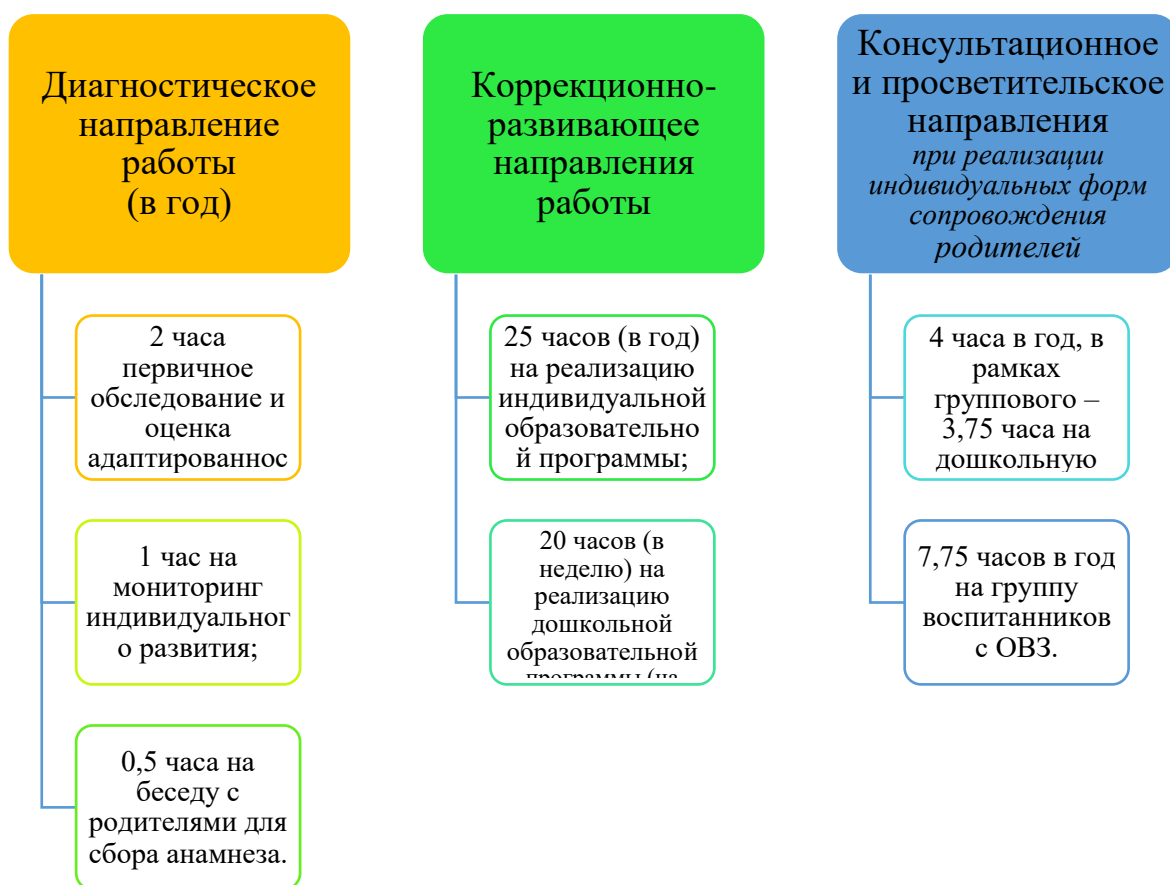
График организации образовательного процесса

В соответствии с письмом Минобрнауки РФ от 24.09.2009 N 06-1216 «О совершенствовании комплексной многопрофильной психолого-педагогической и медико-социально- правовой помощи обучающимся, воспитанникам», на каждого ребенка с ОВЗ