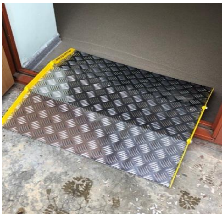
Фото 4. Перекатной пандус.